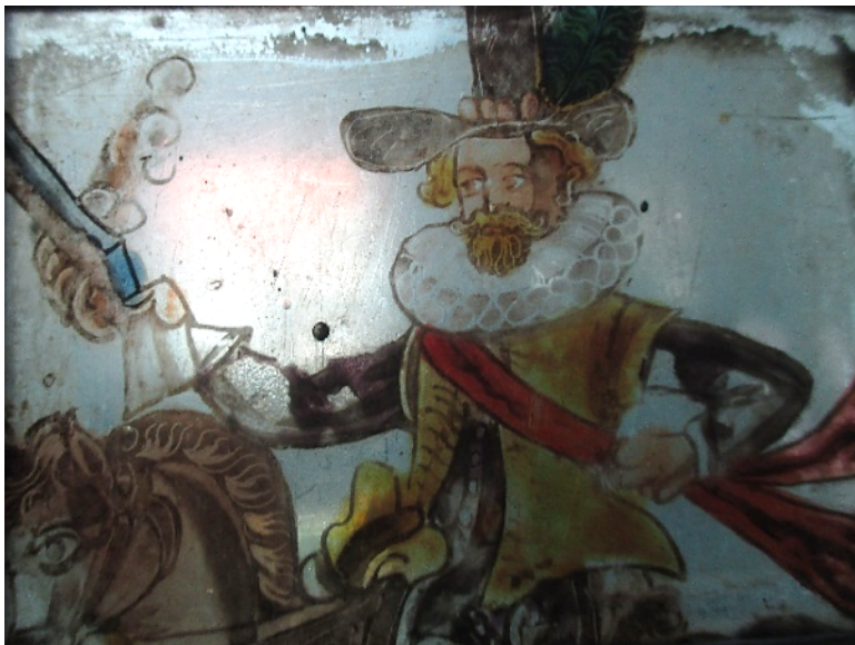
Reiter aus der Zeit des Dreißigjährigen Krieges, Auszug aus einer Fensterzehrung, Museum der Stadt Lübbecke