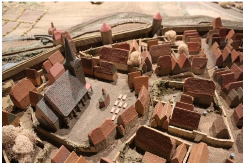
Blick auf die St.-Andreas-Kirche Lübbecke mit Friedhof, Auszug aus dem Stadtmodell des Museums der Stadt Lübbecke

Zahlreiche Fälle von Schuldforderungen wurden dem Gericht vorgetragen. Manchmal handelte es sich um geringfügige Beträge, die jedoch für den Gläubiger existenziell bedeutend sein konnten. Dann wieder handelte es sich um hohe Summen, die nicht zurückgezahlt werden konnten, so dass auf vereinbarte Sicherheiten zurückgegriffen werden