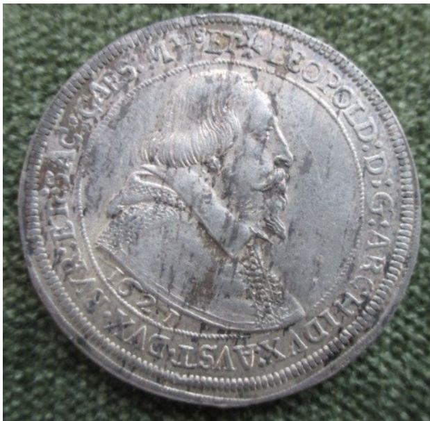
Silbermünze aus dem Dreißigjährigen Krieg aus dem Museum der Stadt Lübbecke