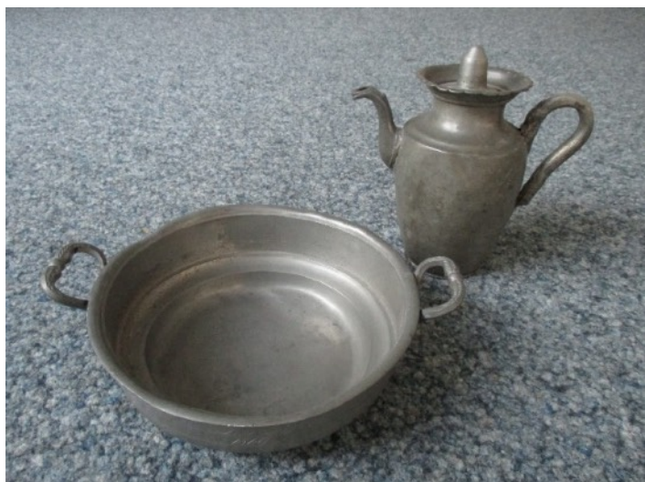
Lübbecke Zinn aus dem Museumsbestand