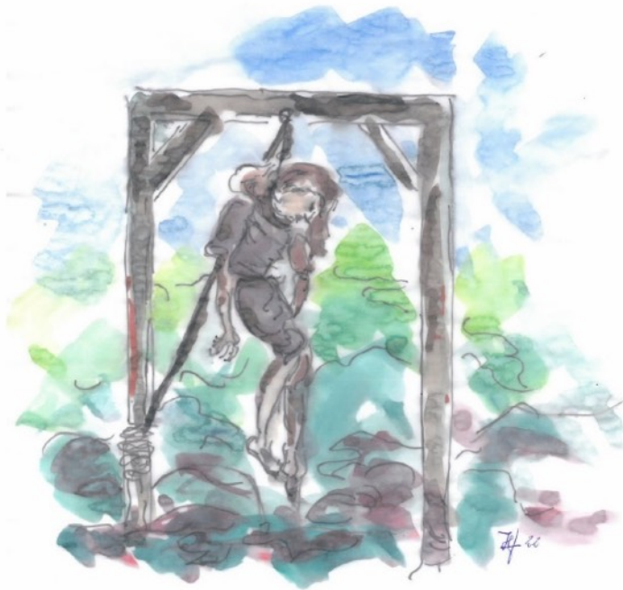
Am Stadtgalgen. Zeichnung: Helmut Hüffmann

„ Wir Ritterschaft, Bürgermeister und Rat der Stadt Lübbecke “ war die offizielle Bezeichnung der Verwaltung, wie sie auch bei Beurkundungen gebraucht wurde. Das Protokollbuch enthält auch eine erweiterte Bezeichnung. In einer erbrechtlichen Verfügung vom 28. Mai 1635 heißt es: „ Wir Ritterschaft Burgermeister und Rat dero Stad Lübbecke in Westphalen. “ 6