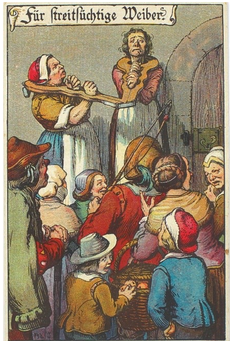
Bewährte Strafe für Zank und Streit – nicht nur bei Frauen – war lange Zeit die Schandgeige. Lithographie und Druck: E. Nister, Nürnberg, um 1905

Dolck präsentierte dem Gericht eine völlig andere Version des Tatherganges. Eine Beleidigung unter Verwendung des Schimpfwortes „Esel“ wies er von sich. Er habe sich, so