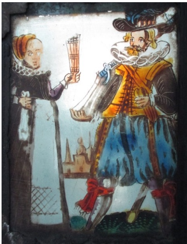
Aus der Zeit des Dreißigjährigen Krieges stammt dieser Ausschnitt aus einer Fensterzierung, die das Reichen eines Getränks zeigt. Museum der Stadt Lübbecke