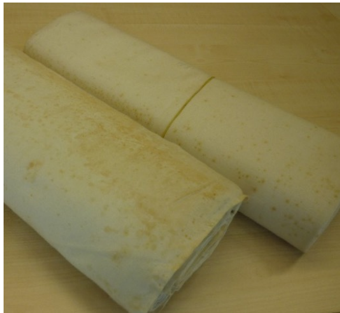
Altes Leinen aus dem Bestand des Museums der Stadt Lübbecke