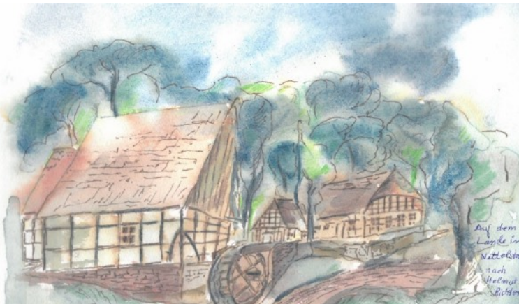
Auf dem Lande in Nettelstedt (nach Helmut Richter), Zeichnung: Helmut Hüffmann

Dem Gogericht saßen die beiden Reineberger Beamten vor. Das waren der Amtmann und sein Sekretär. Ein Gerichtsbote musste immer anwesend sein. Zum Vorstand gehörten auch die Vorsteher aus den Vogteien. Beisitzer des Gerichtsvorstandes waren zwei oder drei Lübbecker Ratsherren, die „mit den fragen und decisionen“ nichts zu tun hatten. Sie hatten lediglich darauf zu achten, dass Markensachen nicht zugelassen wurden. Die Lübbecker Markenhöhe durfte nicht in Frage gestellt werden.