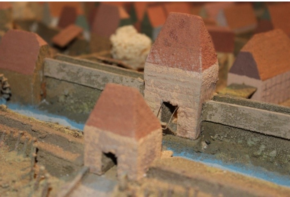
Ostertor und eine der südlich davon gelegenen Mühlen an der Ronceva, Detail aus dem Stadtmodell im Museum der Stadt Lübbecke