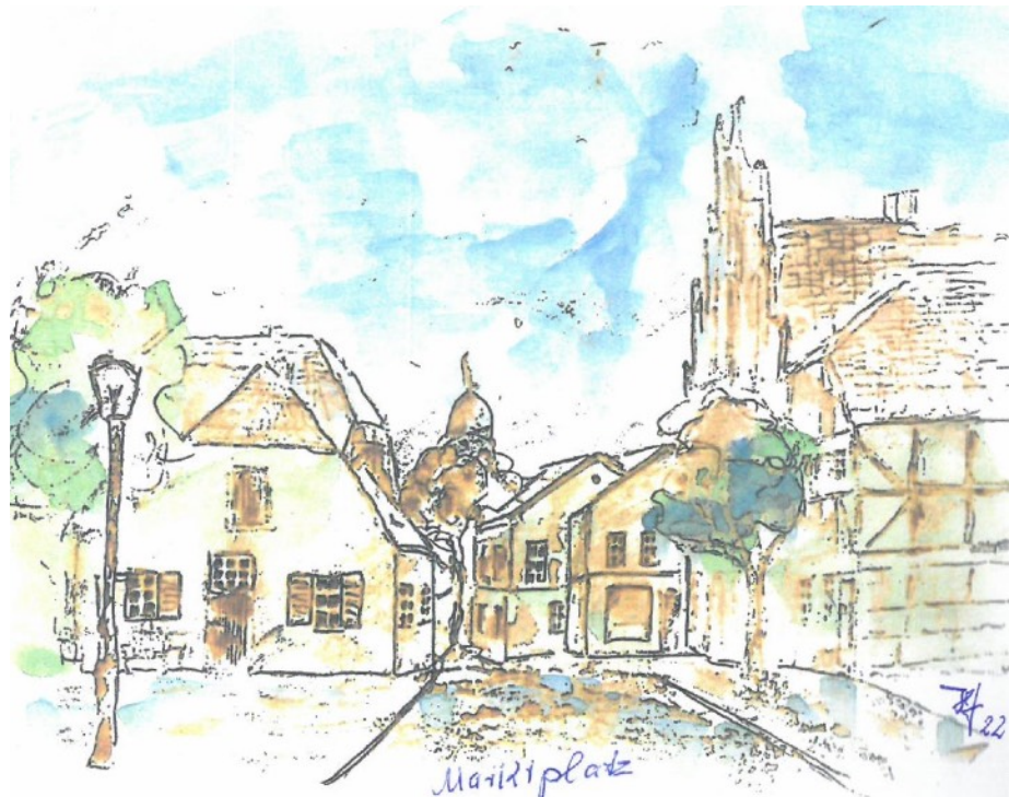
Lübbecker Marktplatz Richtung Westen. Zeichnung: Helmut Hüffmann

„Besser ist friede mit gefehrlichkeit ALB kriegh mit eitel gerechtigkeit.“