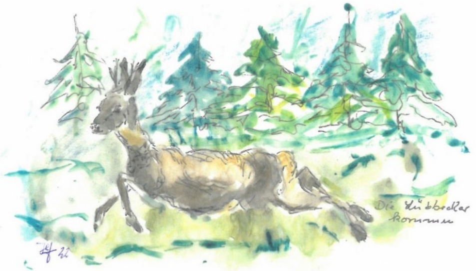
Die Lübbeckler kommen! Zeichnung: Helmut Hüffmann

Die auswärtigen Schuhmacher hatten demnach unehelich geborene Jungen in die Lehre genommen, was nach den Regeln der städtischen Ämter untersagt war. Auch die Abordnung junger Männer zum Militärdienst hatte dem Nachwuchs geschadet.