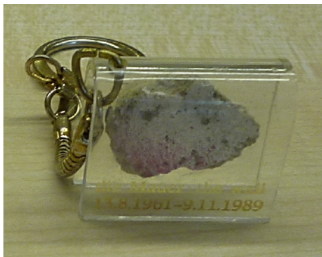
Schlüsselanhänger mit Fragment der Berliner Mauer, 1989, Museum der Stadt Lübbecke

Doch als Gambrinus das nächste Mal seines Amtes waltete, am Bierbrunnensonntag, der 1961 ausgerechnet auf den 13. August fiel, schien die Zeit plötzlich stillzustehen. In den frühen Morgenstunden hatten bewaffnete Verbände der DDR damit begonnen, Straßensperren zwischen West- und Ost-Berlin zu errichten. Stacheldraht wurde ausgelegt, Fenster und Türen von Gebäuden, die unmittelbar an der Grenze lagen, wurden zugemauert. Die U- und S-Bahnen stellten ihre grenzübergreifenden Fahrten ein. Willy Brandt, noch immer auf Wahlkampftour durch die Republik, brach seine Reise ab und kehrte nach Berlin zurück.