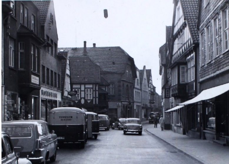
Blick in die Lange Straße Richtung Westen, 1961

Das Bierbrunnenfest 1961 erfreute sich außergewöhnlich guten Zuspruchs. Viele Tausend Gäste waren von nah und fern angereist. Längst war noch nicht überall bekannt geworden, was in Berlin geschah. Doch bereits am 15. August folgten zahlreiche Betriebe im Kreis Lübbecke dem Aufruf des DGB, um 11 Uhr die Arbeit für zwei Minuten einzustellen, um ihren Protest gegen den Mauerbau auszudrücken. Auch viele Autos stoppten aus Solidarität. In den kommenden Monaten konnten mehrfach Abgesandte aus West-Berlin im Lübbecke Land begrüßt werden. Auch machte sich manche Besuchsgruppe aus dem Altkreis auf den Weg nach Berlin. Damit nahmen sie bereits vorweg, was 1963 der amerikanische Präsident John F. Kennedy in Berlin so formulierte: