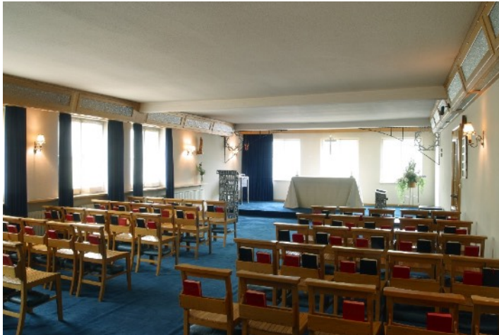
Kapelle im Church House, Lübbecke, 2002

Beliebtheit und wurde von Soldaten frequentiert, die weltweit im Einsatz waren. Auch Einheimische erhielten während der letzten Jahrzehnte (begrenzt) Zugang, so zum Beispiel das Lübbecke Bürgerbeschützenbataillon, das das Grundstück nutzt, um zu seinem Schießstand zu gelangen.