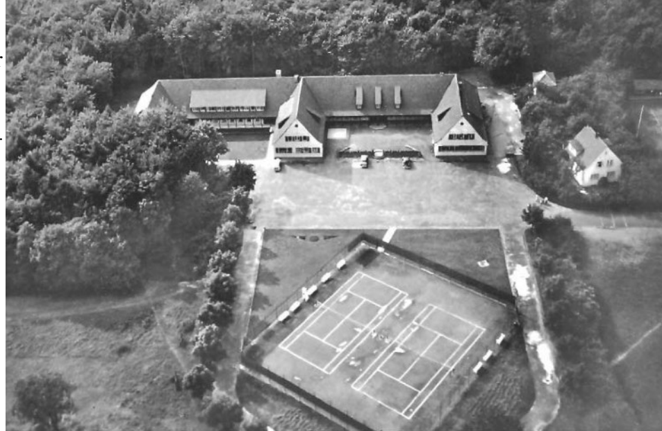
Britische Offiziersmesse, Wartturmstraße 27-29, Lübbecke, 1960. Oben links der Anbau aus den 1950er-Jahren.

Bereits am 29. Juni 1945 veröffentlichte die Neue Westfälische Zeitung , das Nachrichtenblatt der alliierten Militärbehörden, in der Ausgabe für Minden-Ravensberg-Lippe die entsprechende Bekanntmachung: „Lübbecke wird britisches Hauptquartier . Lübbecke in Westfalen mit seinen 12.000 Einwohnern, 25 km von Minden, ist zur Verwaltungshauptstadt der britischen Besatzungszone bestimmt worden. Quartiermacher der britischen Kontrollkommission sind bereits in Lübbecke eingetroffen.“ 8