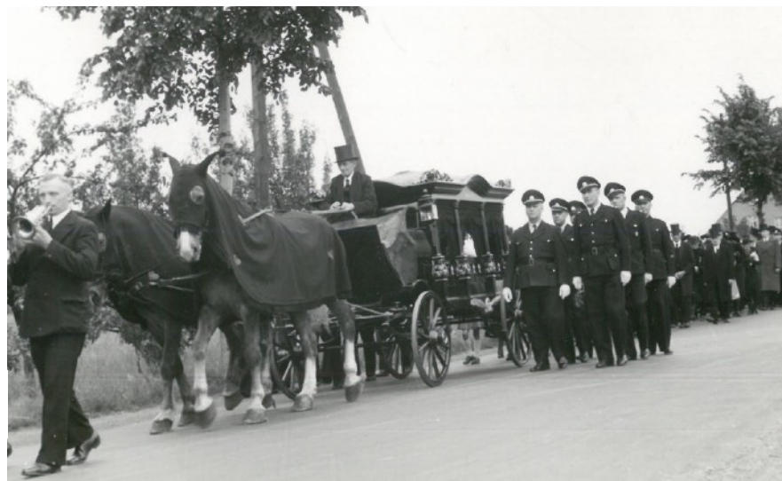
Trauerzug in Blasheim, 1949

Ebenso wichtig war es aber vielen, dass sie nach ihrem Ableben nicht als „ Stille Leiche “, also ohne kirchliche Zeremonien, beigesetzt wurden. Zumindest zu einer „ Gewöhnlichen Leiche “ sollte es reichen, bei der der Pas-