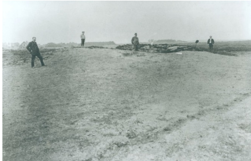
Urnengräber in Tonnenheide, 1920er-Jahre

Damals hatten Bauern, als sie mit ihren Pferden die Felder pflügten, mehrfach Urnen und Knochenreste entdeckt.