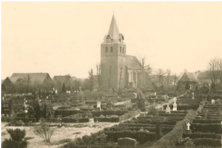
Friedhof Gehlenbeck, 1950

läßt noch einmal das Bild des Verstorbenen vor dem inneren Auge entstehen. Während des Ganges zum Friedhof, der auf einem Grundstück von Siekmeyer No. 4 im Jahre 1900 angelegt wurde, haben die Nachbarn die Diele schnell umgewandelt. Weißgedeckte Tische mit Kaffeetassen und lose auf das saubere Tischtuch geschüttete 'Likenstuten' ['Leichenstuten'] laden die von auswärts gekommenen Trauergäste zur Stärkung ein. Der Kantor spricht das Gebet, man ißt in ernster Schweigsamkeit, singt noch einige passende Strophen und geht nach dem Schlußgebet des Kantors noch eben bei den Verwandten vor, die in Nettelstedt wohnen, und dann der Heimat zu. Es ist üblich, daß bei Kindern kein Pastor kommt. Sie werden vom Kantor beerdigt. Vor ungefähr 40 Jahren gab es für die von auswärts kommenden Trauergäste Erbsensuppe und einige Zeit früher wurde während des Gesanges Schnaps und Bier rundgereicht. Alte Leute erzählen, daß es früher auch Sitte gewesen sei, sich nach der Beerdigung im Wirtshaus zu treffen. Man nannte das 'das Fell versaufen'. Die 'gute alte Zeit' war doch manchmal recht rauh in ihren Gebräuchen."