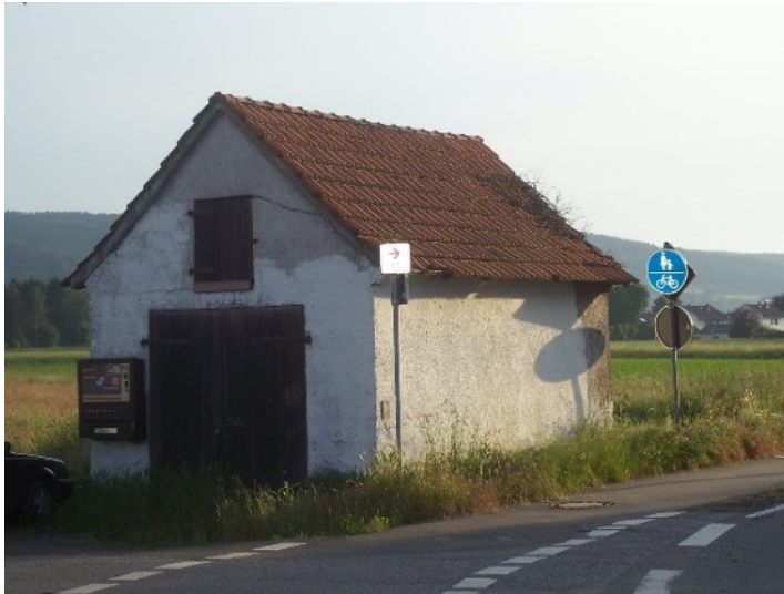
Ehemaliger Unterstand für den Leichenwagen in Nettelstedt, 2008

Die Bewohner auf dem Husen und dem Aspel in Nettelstedt hatten aber bereits gemeinsam eine Drechselmaschine und einen Totenwagen angeschafft. Für diesen hatten sie eigens einen Unterstand gebaut. So machten sie deutlich, dass sie auch auf ihrer letzten Erdenfahrt mit gebührender Würde behandelt werden wollten.