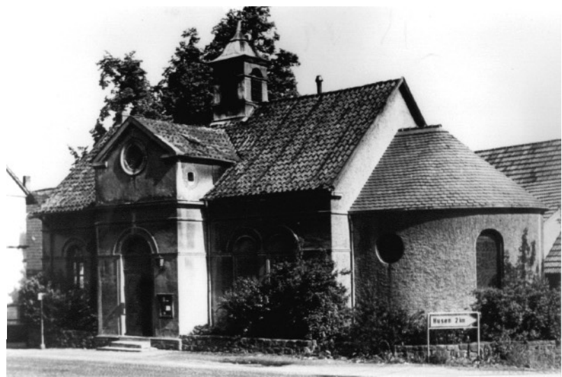
Kapelle Nettelstedt, um 1955