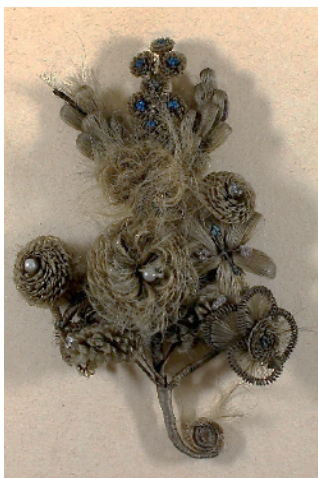
Haarbild, um 1850

Die Menschen gingen seinerzeit jedoch noch ganz anders mit dem Tod um. Er war Teil des täglichen Lebens. Die niedrige Lebenserwartung, die hohe Kindersterblichkeit und die häufigen Todesfälle junger Mütter im Kindbett führten jedem die eigene Sterblichkeit immer wieder deutlich vor Augen. Wohl dem, der dann ausgerüstet mit den Sterbesakramenten oder gestärkt durch die Feier des Abendmahls, im Kreise seiner Angehörigen verschied!